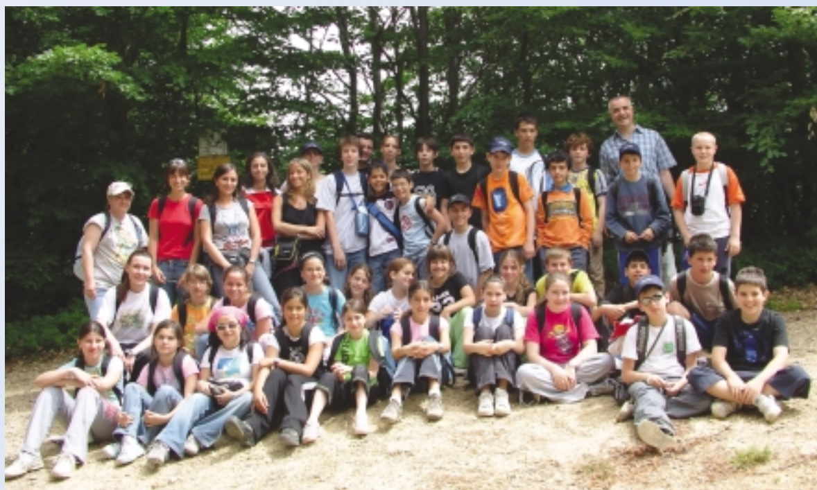
I partecipanti di un campo scuola.